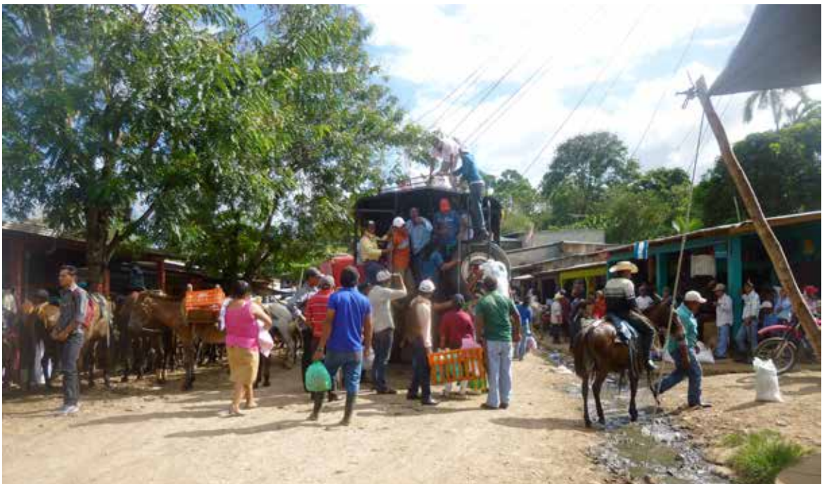
Colonia La Unión – Nueva Guinea. 10 de marzo de 2016. Ambiente de la calle principal de la Colonia la Unión, donde campesinos bajan de sus comunidades a vender y comprar productos. La fotografía fue tomada antes de la reunión con el grupo focal de la Colonia la Unión.

Los Estados partes, como Nicaragua, al Pacto internacional de derechos económicos sociales y culturales reconocen en el artículo 11 (1) el derecho de toda persona a una vivienda adecuada y se comprometen a tomar medidas apropiadas para asegurar la efectividad de este derecho 23 . El Comité de Derechos Económicos, Sociales y Culturales ha detallado en su observación general N° 7 (1997) 24 acerca del derecho a una vivienda adecuada (párrafo 1 del artículo 11 del Pacto) las necesarias salvaguardas para proteger a las personas de expropiaciones arbitrarias referidas como desalojos forzosos de su lugar de residencia 25 y se pueden resumir así: Los desalojos autorizados por una ley para ser conformes con el derecho internacional y los derechos humanos requieren: a) hacerse únicamente con el fin de promover el bienestar general 26 ; b) ser razonable y proporcional; c) estar reglamentado de tal forma que se garantice un recurso efectivo en contra de la decisión del desalojo y una indemnización y rehabilitación completas y justas a favor de las personas objeto del desalojo; d) llevarse a cabo de acuerdo con el derecho internacional relativo a los derechos humanos, e) respetar el derecho a la consulta previa, libre e informada.