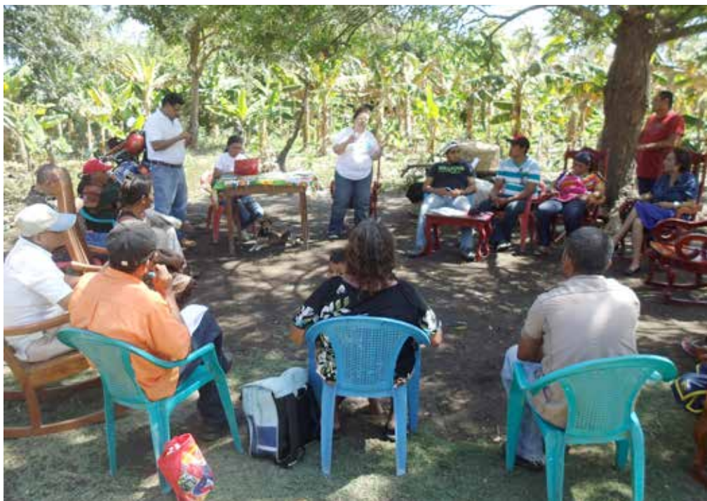
Tolesmaida – Rivas. 24 de febrero de 2016. Equipo del CENIDH, realizando entrevistas al grupo focal en Tolesmaida, recogiendo testimonios de la lucha campesina contra el proyecto del canal y denunciando los atropellos de que han sido víctimas. @CENIDH

En dichos grupos focales que se organizaron bajo criterios de representatividad y equilibrio de género, edad y organización social se pudieron establecer los temas y cuestiones prioritarias de las comunidades. Entre los temas tratados se pudieron establecer las problemáticas de estas comunidades frente al proyecto del Canal y como éste afectaría sus condiciones de vida.