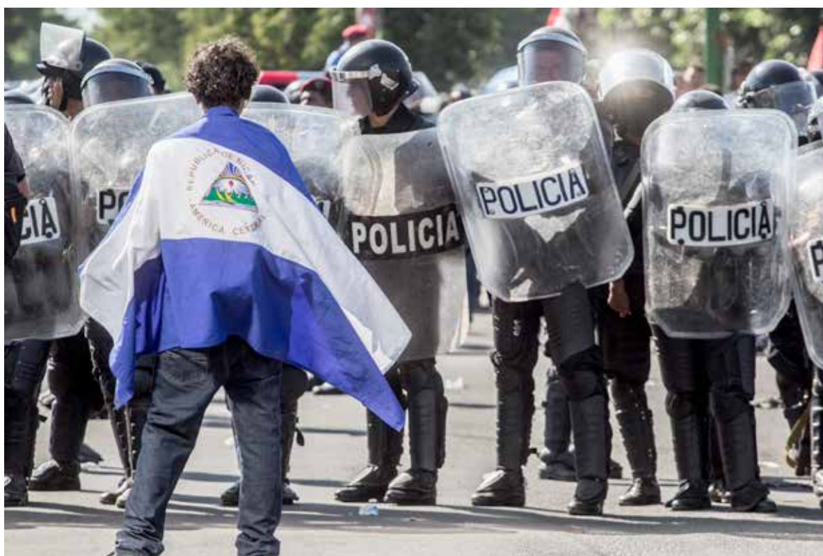
Hombre embanderado, 27/10/2015. Managua: Un hombre embanderado frente a policías antidisturbios, en el marco de una manifestación en contra de la construcción del Canal Interoceánico, el 27 de octubre de 2015.

hijos sufran lo mismo”; “no quiero que mi familia ande posando”; “porque cada persona y niño se desarrolle en lo propio y no vaya a un asentamiento a vivir indignamente”; “es el arrebato de nuestras propiedades”; “mi hija me dice que luche por lo que es nuestro, ella me pregunta a dónde nos vamos a ir, a dónde van a ir los animalitos que tenemos”; “el derecho a que mis difuntos descansen en paz, pues con el canal desaparecerán los cementerios”; “porque aquí nací y aquí pienso morir”; “porque no me consultaron, porque nos trataron peor que animales, como que si no fuésemos humanos, pero somos iguales”; “porque esa ley nos pone en peligro a todos pues dice que pueden expropiar cualquier parte del territorio, les da el derecho a ellos -los chinos- a hacer lo que ellos quieran”; “dos cosas me motivan a luchar porque la ley es antipatriótica y porque nos despoja de nuestros derechos a la propiedad, a vivir libre, a ser patronos y no peones”, “porque es una lucha justa”; “esto no es solo por la defensa de nuestra finca si no por la defensa de la soberanía porque no queremos este país dividido en dos. No queremos pagar por pasar de un lado a otro por un puente hidráulico. Queremos un país unido indisoluble como dice la Constitución”. Son muchas las motivaciones que inspiran y motivan esta lucha, razones que se expresan en la fuerte y autentica movilización campesina frente a este proyecto.